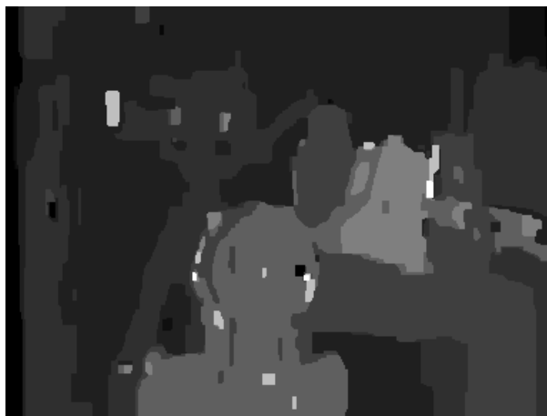
(a) サンプル 1